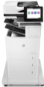
Stampante multifunzione Enterprise HP LaserJet Flow M636z

Questa multifunzione HP LaserJet con JetIntelligence coniuga eccezionali prestazioni ed efficienza energetica con stampa di documenti di qualità professionale proprio nel momento in cui ne avete bisogno, proteggendo la rete da attacchi con le più avanzate funzionalità di sicurezza del settore. 1