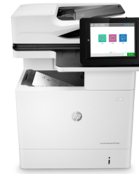
Stampante multifunzione Enterprise HP LaserJet M636fh