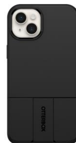
Black 77-91384 (ProPack) 840304716043